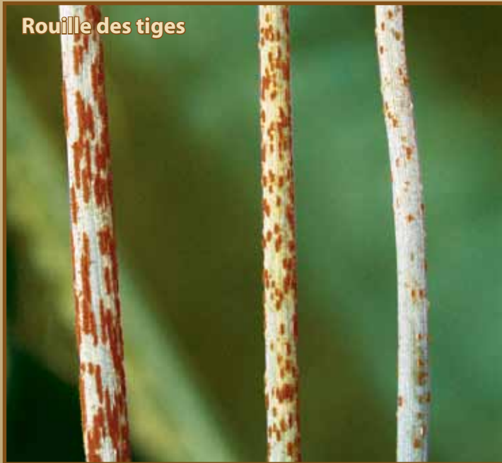
Figure 3. Exemples de symptômes variés causés par la rouille des tiges (plus bas), de la rouille des feuilles (en haut à droite) et de la rouille jaune (en bas à droite) à cause des interactions particulières avec les variétés de blé ou d'orge.

Les trois maladies ont des interactions particulières avec les variétés plus répandues de blé et d'orge. Ces interactions peuvent modifier les symptômes de la maladie comme réduire la taille des lésions et les superficies de tissus jaunes ou havane qui les entourent (figure 3). En se familiarisant avec la gamme de symptômes possibles de ces maladies le producteur peut améliorer la précision du diagnostic et la maîtrise de ces maladies d'importance économique.