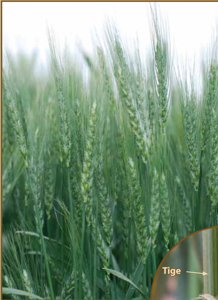
Figure 1. Pour diagnostiquer les maladies de la rouille il faut connaître l'anatomie de base du végétal et une révision rapide de ces notions permet de mieux cibler le processus d'identification.

hôte et des conditions météorologiques, mais elles sont aussi influencées par le moment où surviennent les épidémies et la gravité de celles-ci en rapport avec le stade de croissance de la culture. Les plus grandes pertes de rendement se produisent quand une ou plusieurs de ces maladies se déclarent avant le stade de croissance de l'épiaison. La détection précoce et l'identification adéquate sont primordiales à la lutte contre les maladies en saison, de même que le choix des cultivars des cultures à venir.